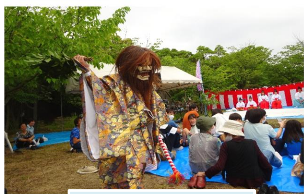
神楽・赤塚佐儀利保存会

トリは迫力ある赤塚神楽「演目：田村」の演舞には客席から大きな拍手が送られていました。