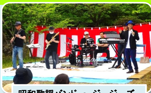
昭和歌謡バンド・ジージーズ