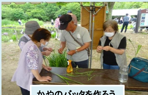
かやのバッタを作ろう

体験コーナーでは恒例となったカヤの葉で作る本物そっくりのバッタに感動し、自らも作りたいと挑戦される方や初心者でも簡単にできる紙バンドで作る色彩豊かな毬を完成しみなさん楽しいひと時を過ごされていました。