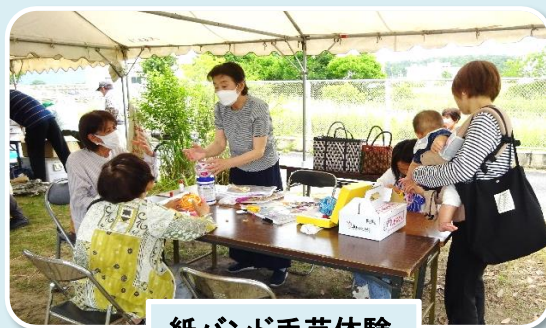
紙バンド手芸体験